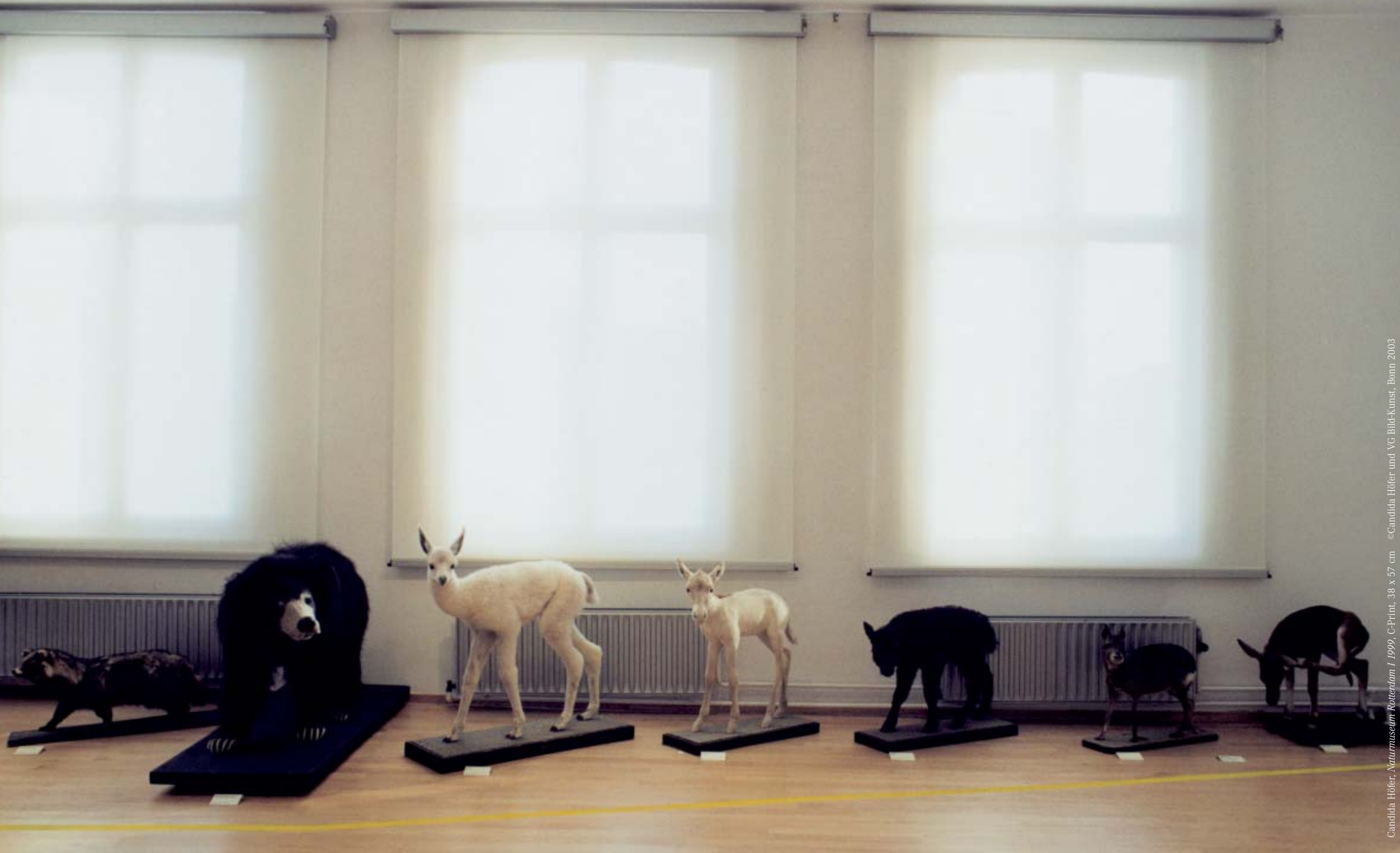
Candida Höfer, Naturmuseum Rotterdam, 1999, C-Print, 38 x 57 cm.